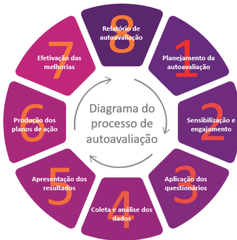
Figura 4 – Diagrama do Processo de Autoavaliação

O processo de autoavaliação do Centro Universitário IBMR foi idealizado em oito etapas, previstas e planejadas para que seus objetivos possam ser alcançados, conforme explicitado a seguir.