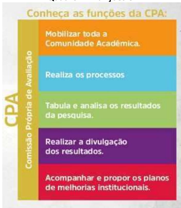
Quadro 4 – Funções CPA